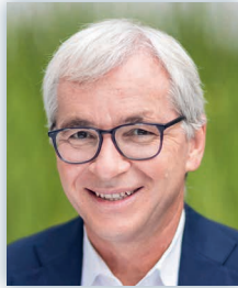
Ständerat Erich Ettlin Präsident der SGK des Ständerates